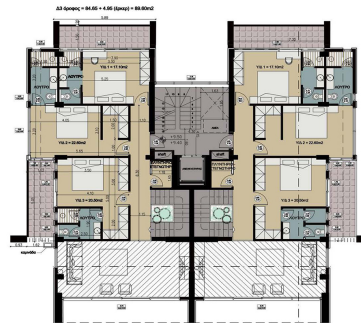
Κάτοψη Γ' Ορόφου

Για τον σχεδιασμό των χώρων δόθηκε ιδιαίτερη έμφαση στην αισθητική και χρησιμοποιήθηκαν υλικά υψηλής ποιότητας καθώς και τα πιο σύγχρονα τεχνολογικά συστήματα θέρμανσης, ψύξης και ασφαλείας.