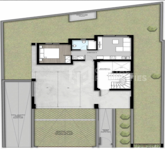
Ground floor - Parking