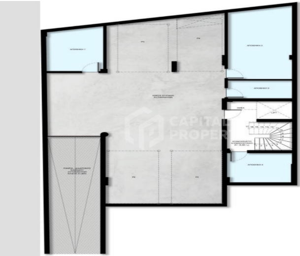
Under ground- Parking and storage