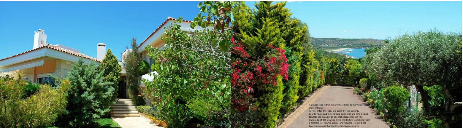
A private road within the premises leads to the Villa's main entrance. As we enter the site, we drive by the security guard's home and the enclosed basketball and tennis court, towards the main cul-de-sac that approaches the villa. Hundreds of tall cypress trees masterfully combined with a plethora of colorful plants and flowers, create a life-breathing canvas that reminisces heaven on earth.